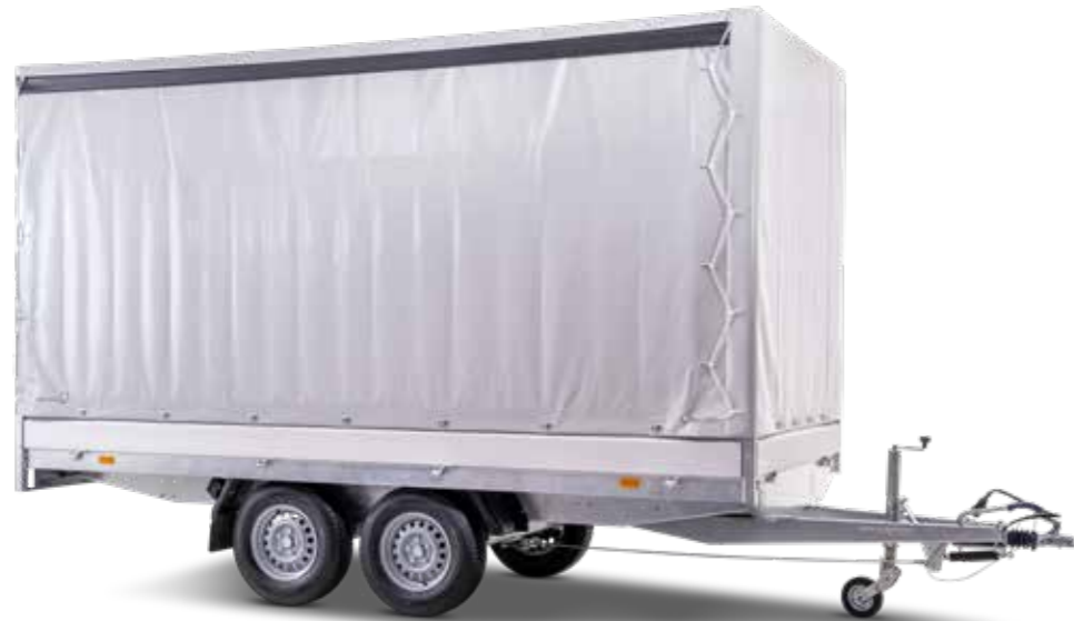
PKW-Anhänger mit Schiebegardine in Fahrtrichtung rechts