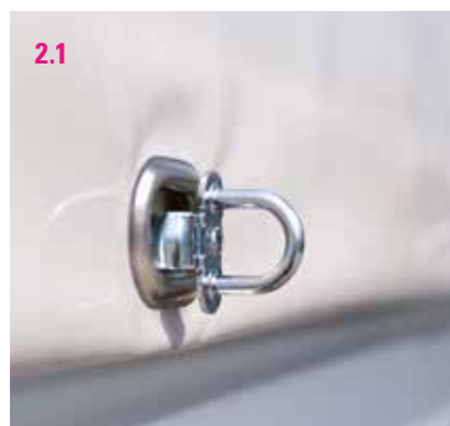
2.1 PDK Metall