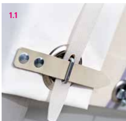
1.1 Senkrechter Riemenverschluss

So lassen sich beispielsweise die senkrechten Verschlüsse 1.1 oder 1.2 mit den waagerechten Verschlüssen 2.1 , 2.2 oder 2.3 kombinieren.