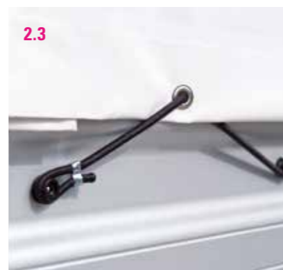
2.3 Kreuzverschluss waagrecht