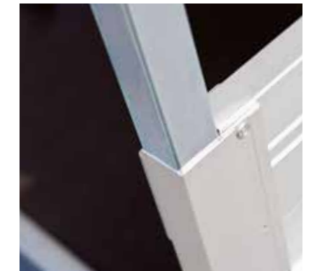
Eckrunge mit Adapter

Die Höhe lässt sich individuell nach Ihren Anforderungen fertigen.