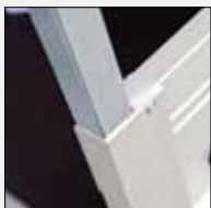
Eckrunge mit Adapter